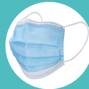
Mascarilla protectora desechable